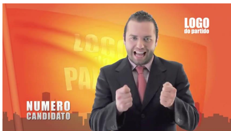
Figura 1 - Frame de Vídeo sobre o formato visual de propagandas políticas.

Os discursos da publicidade, do consumo e da política, por exemplo, são atravessados pelas imagens e convergem subjetividades, estereótipos e representações, fortalecendo-os. O que a ciência e o dinheiro disponibilizam à vida cotidiana, em suas narrativas dominantes, encontram na nova tecnologia da imagem, como o cinema, por exemplo, uma renovação da sensibilidade e da percepção visual, e formas de resistência à racionalização e do senso comum administrado pela mídia. Ou seja, poderia provocar a libertação do olhar ou mesmo revelar, descobrir ou recuperar algo perdido (XAVIER apud MÉDOLA, ARAÚJO, BRUNO, 2007, p. 20-23).