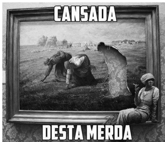
Figura 5 - Acervo do autor. Fonte: facebook.com

Ou seja, o que chamamos de arte, atravessa a própria vida e os meios visuais que nela se apresentam, numa inegável influência que ecoa na reconceitualização do ‘sentido da arte’, pensando-